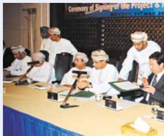
Government and other officials are seen at the signing ceremony. At extr

The balance output will be marketed regionally and internationally by LG International of Korea, which owns 20% of the equity of the project (with the balance being held by Oman Oil Company). The signing took place under the patronage of their Excellencies the Minister of National Economy, the Minister of Oil and Gas, the Minister of Transport and Communications and the Minister of Labour in the Government of the Sultanate of Oman.